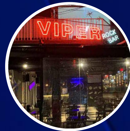
VIPER ROCK BAR