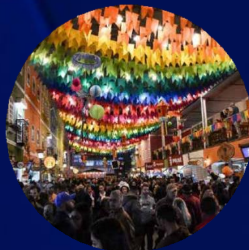
CENTRO DE TRADIÇÕES NORDESTINAS