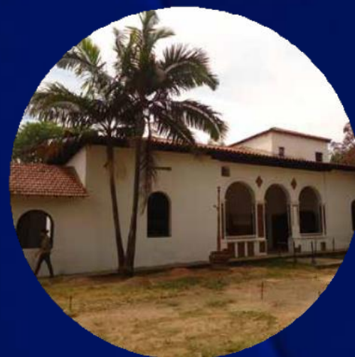
CENTRO DE ARQUEOLOGIA DE SP