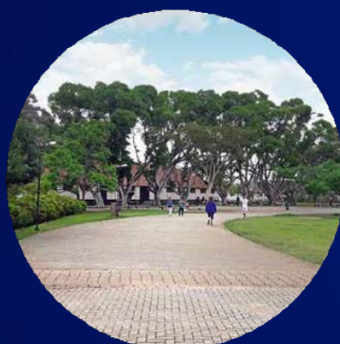
PARQUE DO TROTE