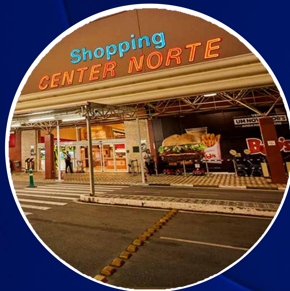
SHOPPING CENTER NORTE