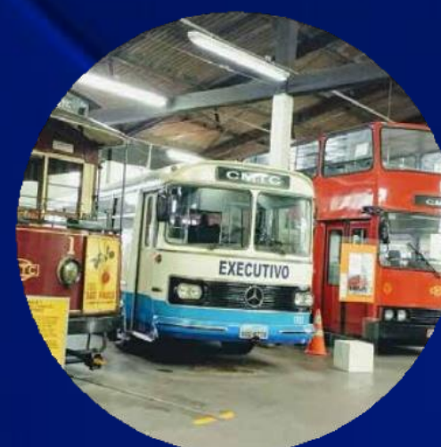
MUSEU DO TRANSPORTE PÚBLICO