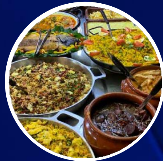
FAZENDA DO CAIPIRA