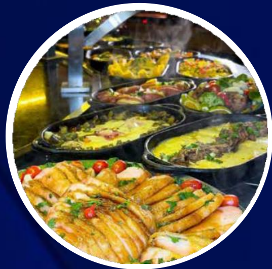
CELEIRO DA FAZENDA