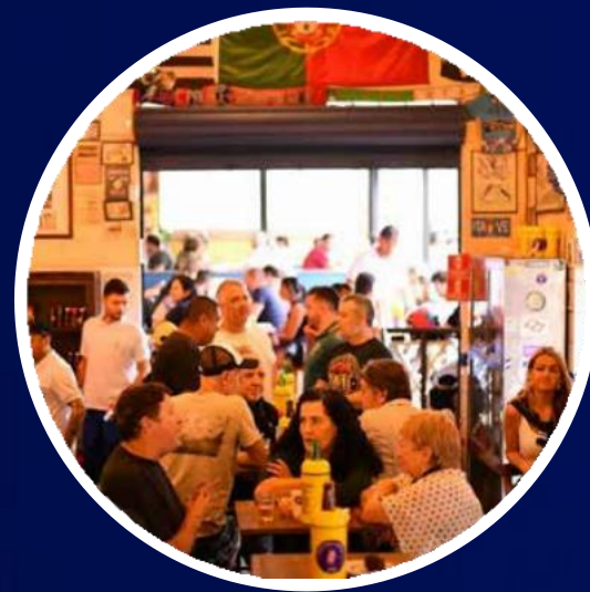
BAR DO LUIZ