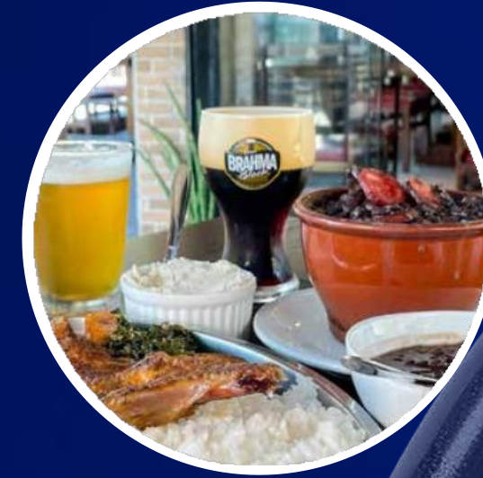
ESPAÇO PAU BRASIL