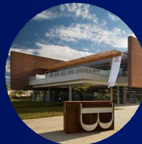
BIBLIOTECA DE SÃO PAULO