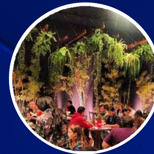
SPETOO PICANHA E BAR