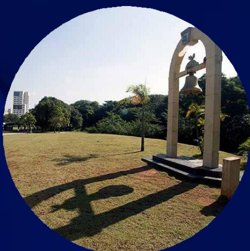
PARQUE DA JUVENTUDE